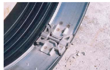
ステンレスウェッジ